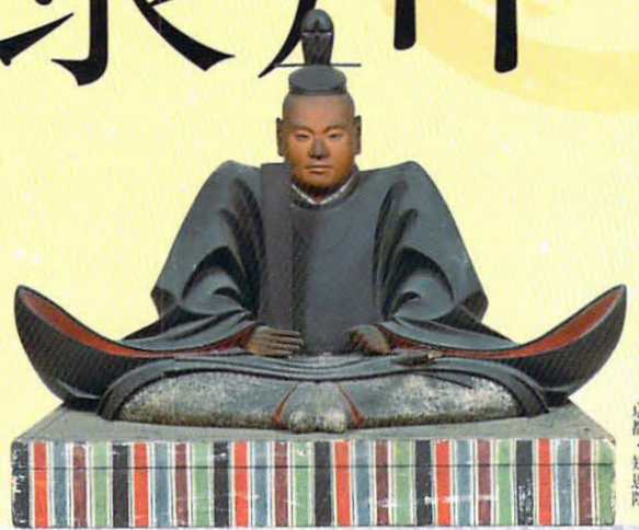
重文 徳川家康坐像 京都・知恩院