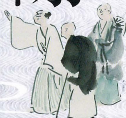
重文 奥の細道図巻 上巻(冒頭場面) 与謝蕪村筆 京都国立博物館

画俳両道に才を発揮した与謝蕪村ですが、こと絵画の制作に関しては晩成の人でした。明・清時代の絵画にならうたいかにも中国風の作品や、当時の狩野派に学んだいささか硬い線描を見せる作品など、比較的初期の作品に比べると、晩年作との違いに驚かされます。柔らかな筆触と淡彩を特色とする山水図、あるいは親しみやすく洒落な俳画は、蕪村芸術の真骨頂を示しているでしょう。