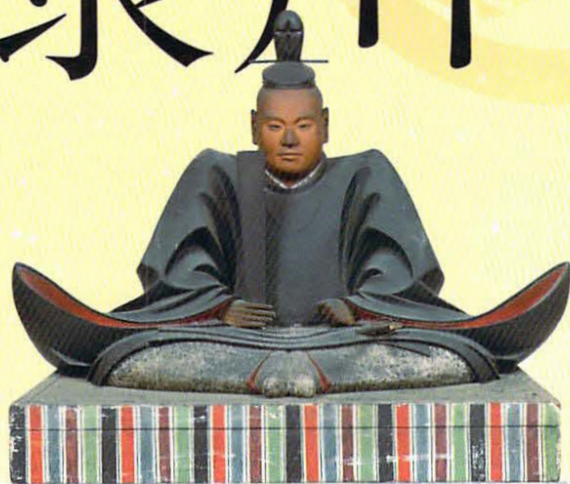
重文 徳川家康坐像 京都・知恩院

戦国の覇者として江戸幕府を開いた徳川家康は、元和二年(一六二六)四月十七日に七十五才でその生涯を閉じました。関西では家康のライバルであった豊臣秀吉の人氣が高いのですが、徳川将軍家が新しい秩序の支配者として京都の寺社を保護したことは忘れてはならない歴史的事実です。本展では、二〇一四年に重要文化財に指定された徳川家康・秀忠坐像(知恩院蔵)を公開し、知恩院を軸としてその意外と知られていない歴史をご紹介します。