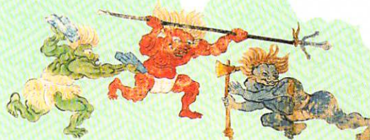
※会期中一部展示替えがあります。